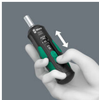
Enkel inställning av valbara åtdragningsmoment.