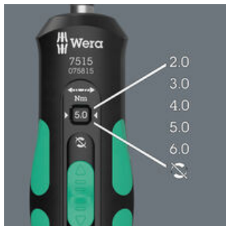
Fem valbara åtdragningsmoment (2,0; 3,0; 4,0; 5,0; 6,0 Nm) och ett fast läge (Torque Lock) för obegränsat lossnings- och åtdragningsmoment.