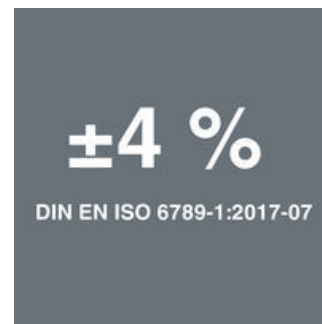
Click-Torque A 6

Vi ville göra arbete med momentnycklar enkelt och precist. Därför har vi utvecklat momentnyckeln Click-Torque. Genom möjligheten att helt enkelt ställa in och spara börvärdet och den robusta konstruktionen är dessa momentnycklar det perfekta verktyget för all skruvdragning som kräver momentstyrd åtdragning (momentsnycklar) respektive åtdragning och lossning (momentnycklar för insatsverktyg) av skruvförbandet.