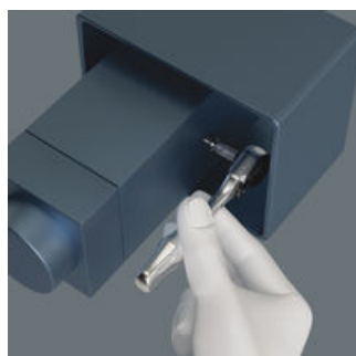
Mini-spärrhandtag för alla svårtillgängliga platser.