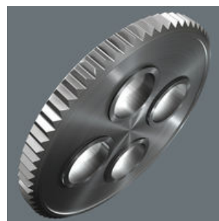
Fintandad mekanism med 60 tänder ger en så kort returvinkel som 6° för precist arbete.