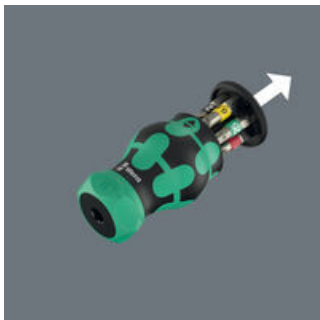
Avattava kahva, jonka sisässä kuuden Bits-kärjen lipas.