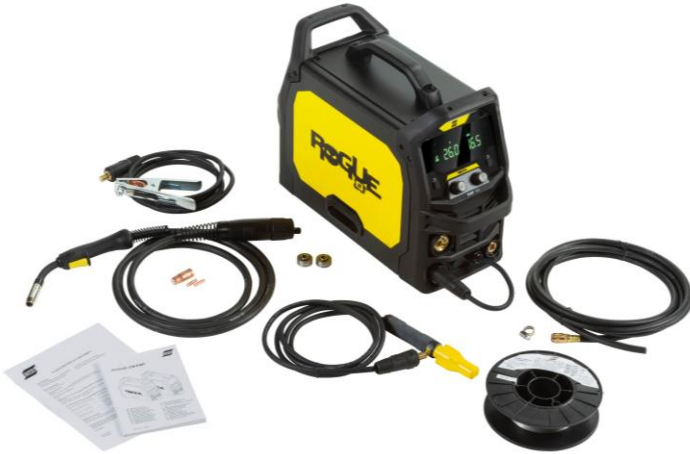
Rogue EM 180