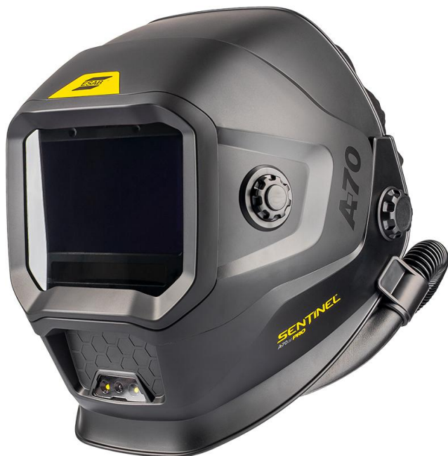
Sentinel A70 Air PRO