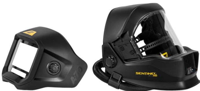
Sentinel A70 Air PRO – irrotettava ADF-lasi