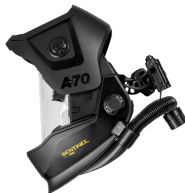
Sentinel A70 Air PRO