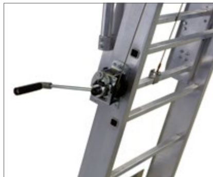
Korkeussäätö vaijerivinssin avulla