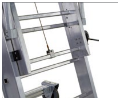
Puoliin lukittava korkeussäätö 280 mm välein