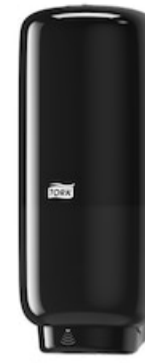
Tork Soap-Sanit Disp – Int Sens, bl 561608