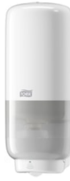
Tork annost vaahtos. sensor valk S4 561600