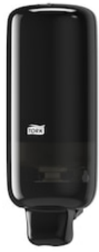
Tork annostelij vaahtoaipp must S4 561508