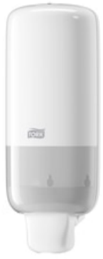
Tork annostelij vaahtoaipp valk S4 561500