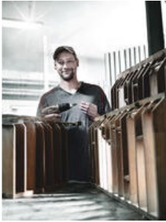
Bits-kärjet kavennetulla varrella