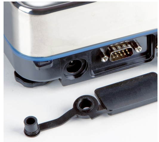
Vakio-ominaisuus: IP65-suojatut liitännät