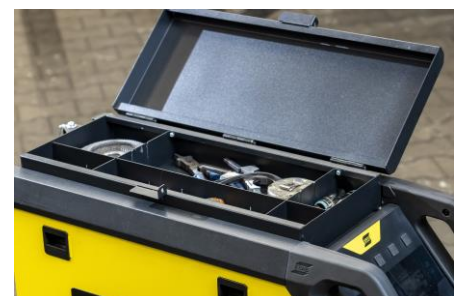
Lisävarusteena ylätyökalulaatikko lisävarusteita varten