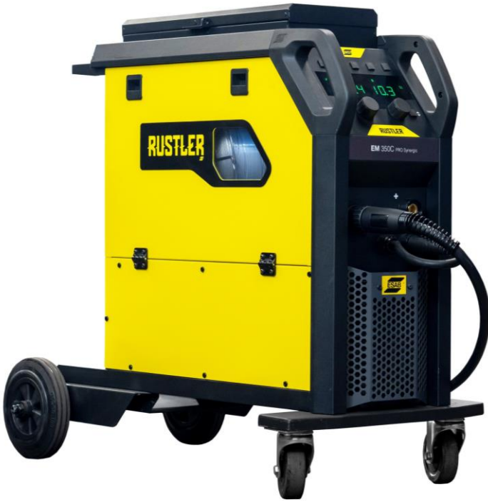
Rustler EM 350C PRO Synergic

Käteväkokoiset Rustler MIG PRO -hitsauskoneet ovat varma valinta yleisiin hitsaustehtäviin. Näissä uusimmalla invertteri-teknologialla varustetuissa koneissa yhdistyvät pieni energiankulutus ja optimoitu hitsausteho.