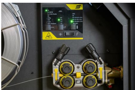
Luokkansa paras langansyöttömekanismi