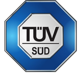
500-1000 kg –mallit