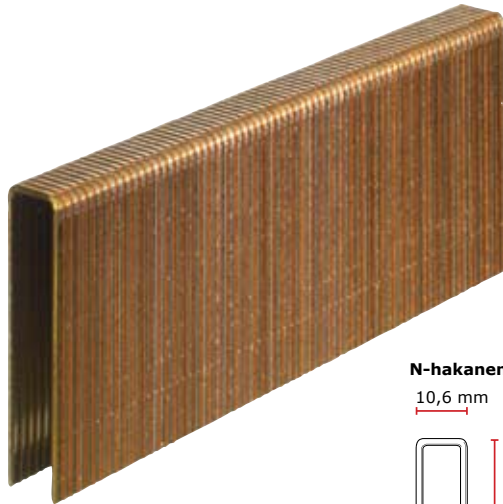
N-hakanen 10,6 mm