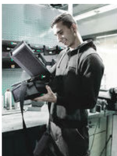
Wera 2go 1 – Tilaihme