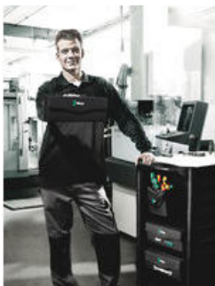
Wera 2go 3 – Tilaihme